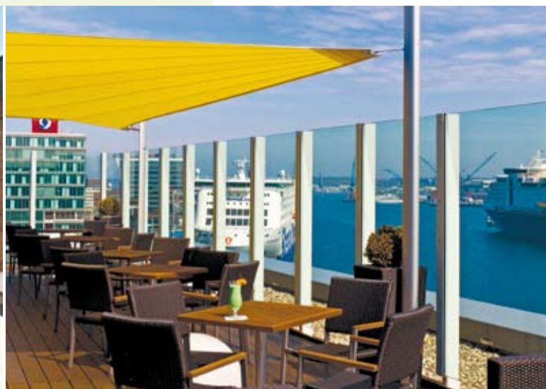
Den Sommer vor einzigartiger Kulisse genießen: im historisch gestalteten Innenhof des ATLANTIC Grand Hotel Bremen (links) oder auf der Dachterrasse des ATLANTIC Hotel Kiel mit Blick auf die Kieler Förde

zum Barbecue@alto, für Kaffee und Kuchen oder für ein ausgedehntes Abendessen.