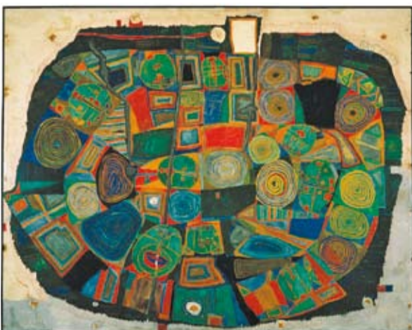
Friedensreich Hundertwasser „Der Garten der glücklichen Toten“, 1953 © 2012 Namida AG, Glarus/Schweiz

Die Kunsthalle Bremen wirft einen frischen Blick auf den österreichischen Künstler. Vom 20. Oktober 2012 bis 17. Februar 2013 präsentiert die Kunsthalle Bremen die große Sonderausstellung „Friedensreich Hundertwasser: Gegen den Strich. Werke 1949–1970“. Mit einer beeindruckenden Auswahl wenig bekannter Arbeiten aus den späten 1940er und 1950er Jahren sowie klassischen Meisterwerken werden neue Perspektiven auf das Werk des Künstlers eröffnet. Gleichwohl einer der bekanntesten Künstler des 20. Jahrhunderts, wurde Hundertwasser aber auch oft missverstanden und unterschätzt. Die Ausstellung zeigt den Künstler als wichtiges Mitglied der internationalen Avantgarde. + Weitere Infos unter: > www.kunsthalle-bremen.de